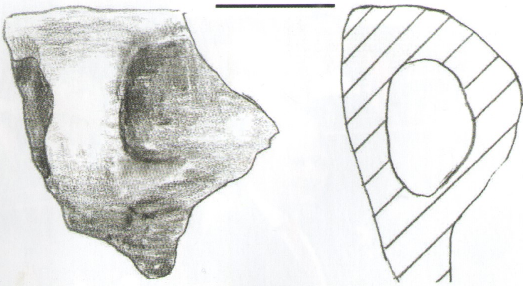
■ Stanowisko Krzywanice 1 – ucho od naczynia ceramicznego z okresu kultury łużyckiej.