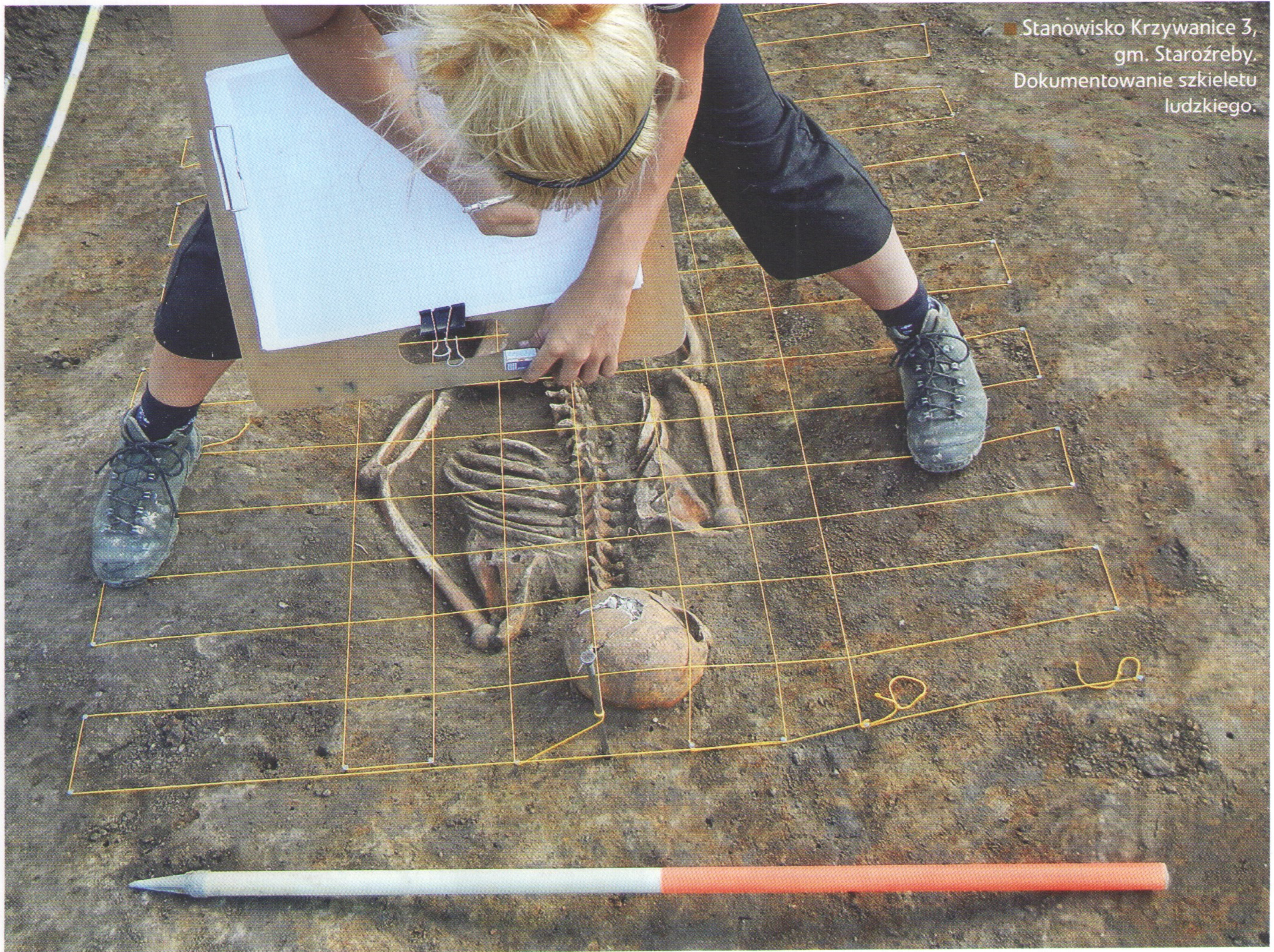
Stanowisko Krzywanice 3, gm. Staroźreby. Dokumentowanie szkieletu ludzkiego.